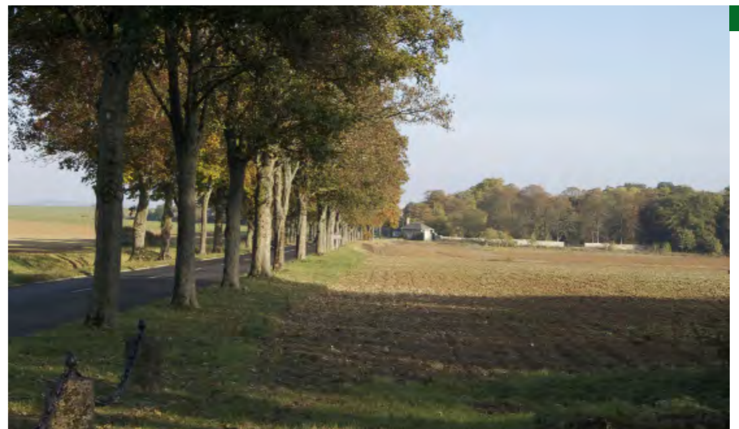
En haut à droite : les retenues d'eau En bas, à droite : D 330 entre Villemétrie et Mont-Levêque